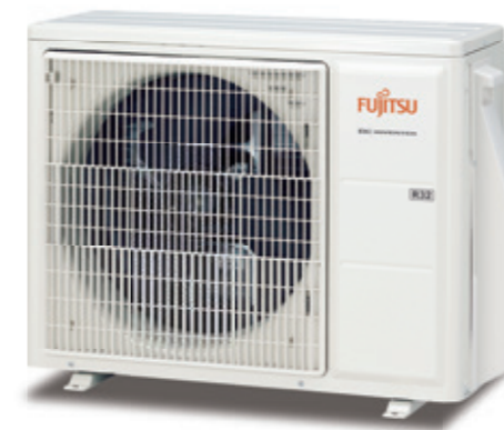
ASY 50-71 UI-KL